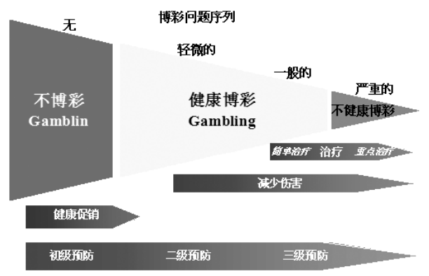
图 2 从公共健康角度看博彩及相关问题