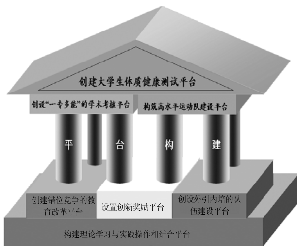
图2 理论学习与实践操作相结合的平台建构图

通过调查了解到,目前更多的教师希望能在名师指点下,学习体育人文知识、信息技术知识,掌握国外体育教学理论与实践,交流教材教法、教学技能,更快提高自身的专业能力。因此,学校或学院应为青年教师搭建理论学习与实践操作相结合的平台,满足教师的实际需求。有条件的学校或学院更可通过体育学科基本知识、理念、技能,教育学课程、心理健康教育课程、教学技能技术课程等“多元模式”的培训,弥补当前教师专业化程度较低的现状,建构“公共体育专业化”教师的知识技能体系。通过组织听课、评课,专项教材内容分析、教材教法研讨、讲座等促进与同行、专家的交流与学习,并组织外出考察学习或网络教研等,为青年教师的专业发展提供交流与学习的平台(见图2),以提高教师的专项知识和技能,教学指导能力、教学反思能力、教学科研能力、教材教学对象分析能力、教学资源开发与利用能力,更好地促进教师的专业发展,保证普通高校公共体育专业化发展的实现。