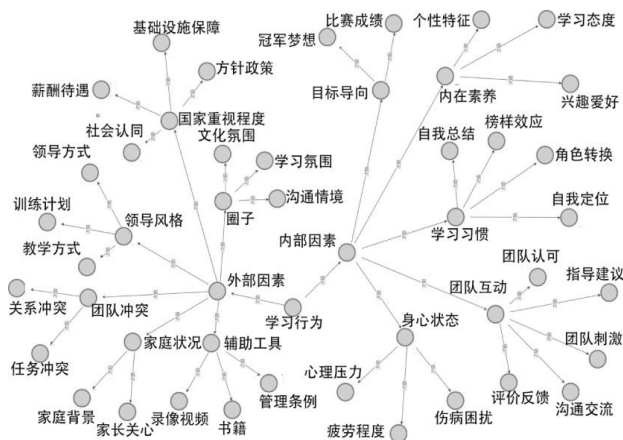
图3 核心式编码内容示意图

以学习主体——运动员为依据进行划分，将影响因素的核心类别定为内群体和外群体，即内部因素、外部因素和内外因素的相互协同，由此构成了自由式滑雪空中技巧集训队学习行为影响因素的基本框架(图3)。