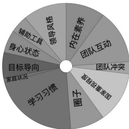
图2 节点内容示意图

二级编码又称关联式登录，是为了发现和建立众多概念类属间的各种联系，以表现资料中各个部分间的相互联系和有机关联而进行的编码 [16] 。本研究将所获得的34个自由节点进行归类，选取意义相类似的归为同一个概念，区别较大的分为不同的概念，即赋予概念应有的明显内部相似性和外部区分度，以深度分析形成树状节点。在关联式登录中，本研究将心理压力、疲劳程度、伤病困扰归为一类，命名为“身心状态”；将榜样效应、角色转换、自我定位、自我总结归为一类，命名为“学习习惯”；将兴趣爱好、个性特征、学习态度归类为“内在素养”；将冠军梦想和比赛成绩归为一类，命名为“目标导向”；将沟通交流、评价反馈、团队刺激、团队认可、指导建议归类为“团队互动”；将关系冲突和任务冲突命名为“团队冲突”；将领导方式、教学方式和训练计划归为一类，命名为“领导风格”；将社会认同、方针政策、薪酬待遇、基础设施保障归类为一类，命名为“国家重视程度”；将学习氛围、文化氛围、沟通情境归类为“圈子”；将管理条例、书籍、录像视频归类为“辅助工具”；将家庭背景和家庭关心归类为“家庭状况”。本研究最终建立了11个树状节点(图2)，包含：目标导向、团队冲突、领导风格、身心状态、学习习惯、国家重视程度、家庭状况、圈子、辅助工具、内在素养、团队互动。