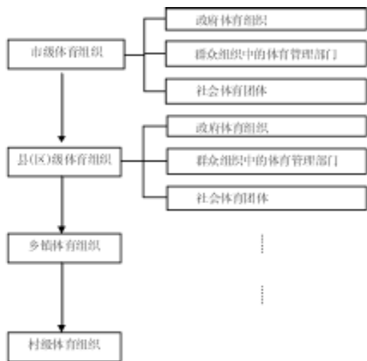
图4 上海农村体育的组织体系

根据上海农村体育发展实际与上海农村体育管理组织发展现状，课题组构建出组织网络图（见图4）。