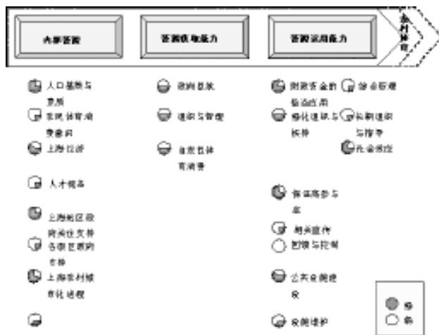
图3 上海发展农村体育能力优势与劣势 Figure 3 Advantages and disadvantages of Shanghai's Ability in Developing Rural Sports