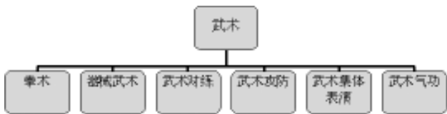
图3 武术类民族传统体育类别划分

武术按照不同的分类标准可以有多种分类，按照中国图书馆分类法（1999年版）把武术分为拳术、器械武术、武术对练、武术攻防、武术集体表演、武术气功6类（见图3） [18] 。